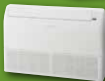
Type AB18RIY, AB24RIY